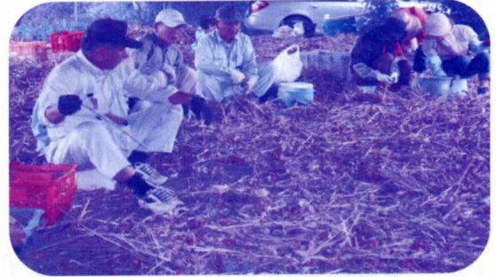
チューリップ球根を揃える作業中