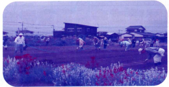
二森農園秋の種まき

「青少年育成市民会議」「花と緑の会」との協働により二森農園(あすてらす南側農園)でいろいろな花苗(春:マリーゴールド、サルビア、千日紅等 秋:きんせんか、ノースポール、花菱草等)を育て(年2回:6～7月、11～12月)に市内の幼保・小・中・高・特別支援学校・校区公民館・公共施設等に配布しました。5月の市民会議定例総会では優秀な花壇を表彰しています。